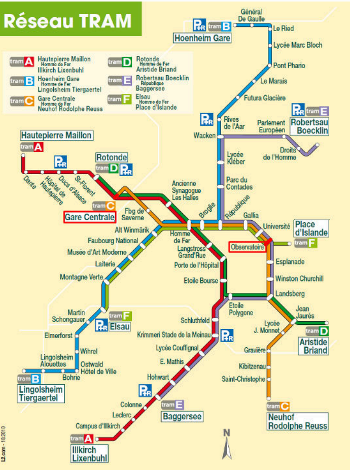
Le réseau Tram fonctionne tous les jours dès 4h30 et jusqu'à 0h30 (Homme de Fer).